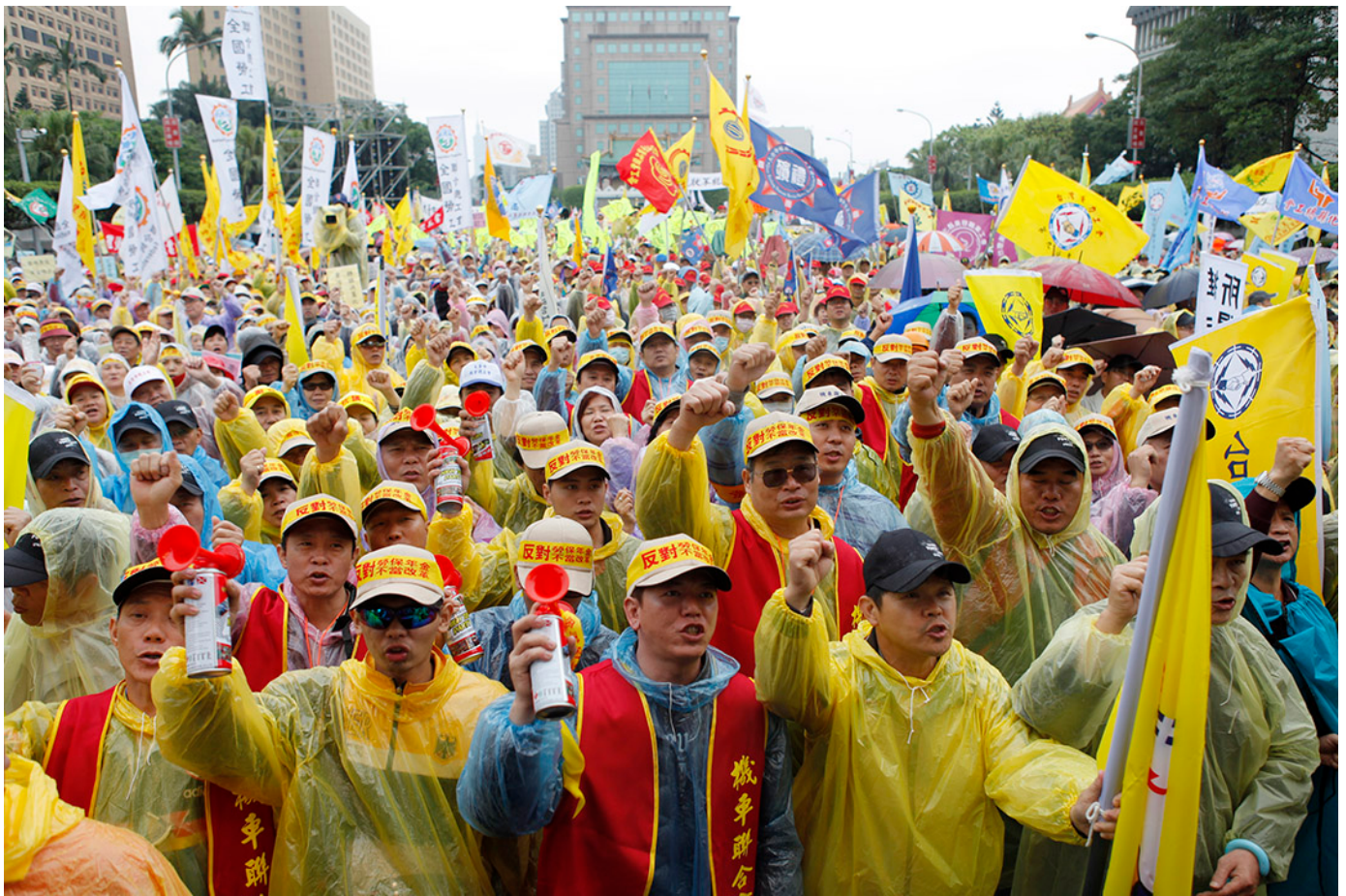
2013年，台北曾有兩萬多名工人在勞動節當日發起遊行抗議勞保年金改革。

【編按】在台灣，公務員、軍人、公立學校教師和勞工等職業各有一套退休年金體系。體系雖然不同，但近年來面臨的共同問題都是基金入不敷出，瀕臨破產，而差別只在破產時間長短而已。